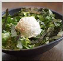
まるりサラダ 430円(473円) ハーフサイズ 270円(297円)