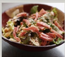
焼きたてベーコンのシーザーサラダ 550円(605円) ハーフサイズ 330円(363円)