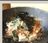
お好み焼き クリームチーズやくこ 410円(451円)