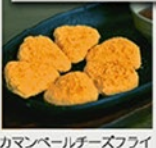
かまぼくチーズフライ 520円(572円)