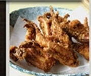
イカげそから揚げ 450円(495円)