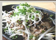
お好み焼き ネギ塩 ポン酢おろし トマトソース カラオケ マヨネーズ