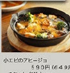
小エビのアヒージョ 590円(649円) パケット(5枚) ~ 150円(165円)