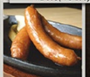
ピリ辛1 Choriso 520円(572円)