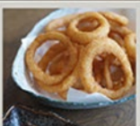
オニオンリングフライ 450円(495円)