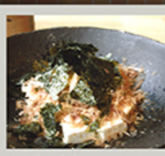
わなびしょう油で クリームチーズやっこ 550円