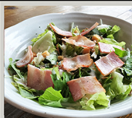
焼きたてベーコンのシーザーサラダ 715円 ハーフサイズ 396円