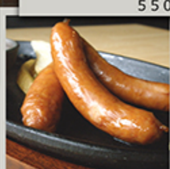
ピリ辛! チョリソー 649円