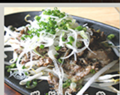
お好みソース デミグラス トマトソース ドライカレー ボン酢おろし ネギ塩 おつまみスジ焼き 638円