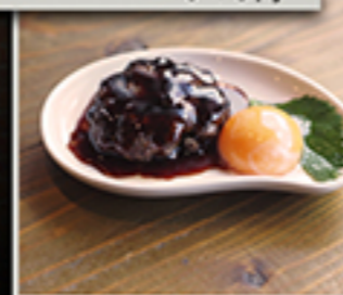
キミもそばにいるよ まるり牛つくね(80g) 550円