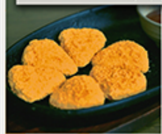
カマンベールチーズフライ 715円