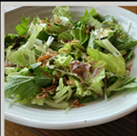
野菜サラダ 550円 ハーフサイズ 297円