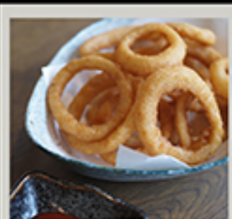
オニオンリングフライ 715円